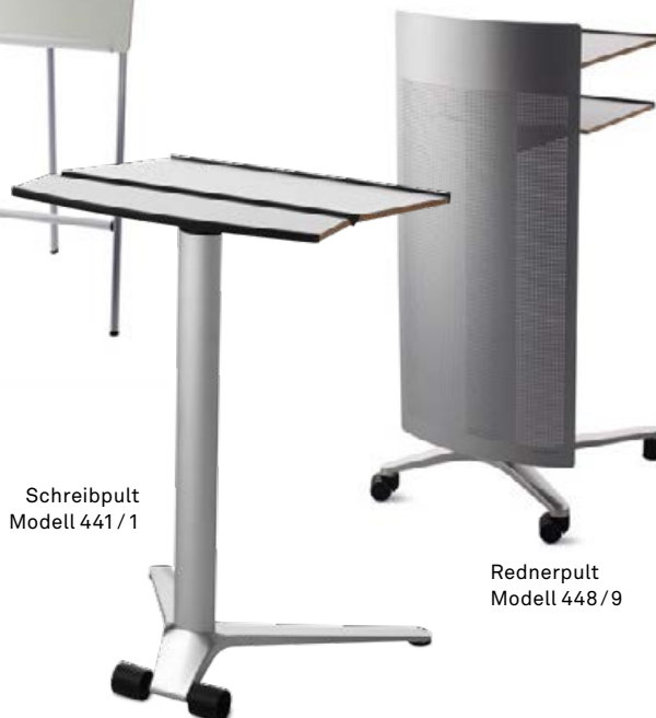
Schreibpult Modell 441 / 1