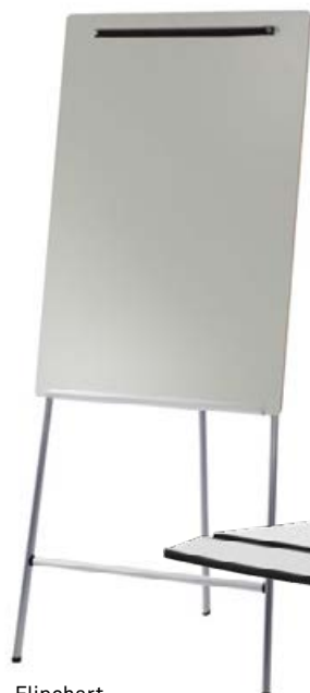
Flipchart Modell 442 / 1