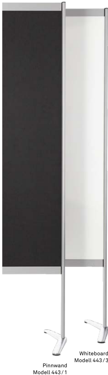
Pinnwand Modell 443 / 1