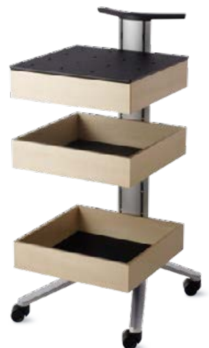
Server Modell 446 / 3

Das Programm Confair steht beispielhaft für die perfekte Verbindung von Imagebildung und Innovationskraft: Hohe Detailqualität, edle Materialien und ein unverwechselbares Design unterstützen Teamgeist und Außenwirkung.