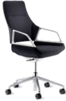
301/8 Fauteuil conférence Dossier mi-haut