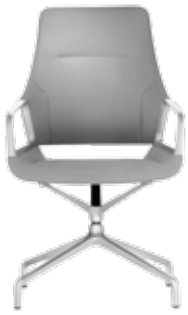
301/5 Fauteuil conférence Dossier mi-haut