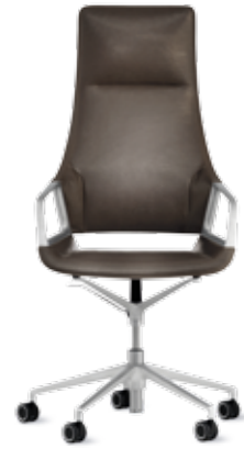
302/7 Fauteuil conférence haut dossier

Le fauteuil conférence Graph se décline en deux hauteurs de dossier – haut ou mi-haut – et en deux versions de piétement – sur patins ou sur roulettes. La structure en aluminium est proposée en quatre finitions : polie, chromée brillant ou laquée au four en deux coloris, blanc ou noir. Elle est complétée par des accoudoirs assortis. Les variantes de revêtements disponibles incluent un choix de tissus très valorisants et les deux cuirs de la collection Wilkhahn.