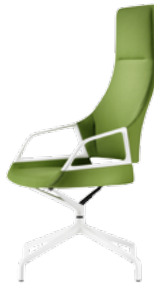
302/5 Fauteuil conférence haut dossier