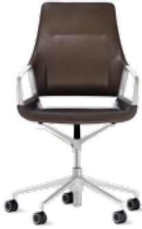
301/7 Fauteuil conférence Dossier mi-haut